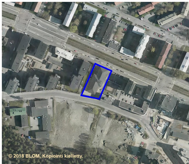
Kaava-alue ilmakuvassa rajattuna yhtenäisellä viivalla.